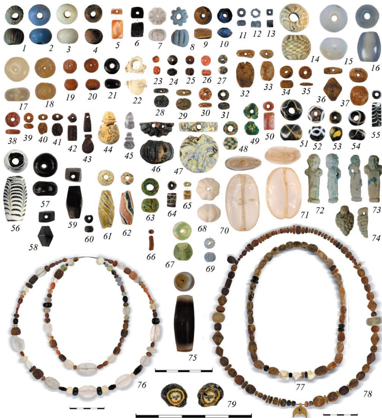
Рис. 2. Бусины и ожерелья. 1–4 – погр. 33; 5 – погр. 89; 6, 7 – погр. 327; 8 – погр. 31; 9, 10 – погр. 13; 11–13 – погр. 174; 14, 15 – погр. 63; 17–20, 23–27, 34–43, 78 – погр. 300; 21 – погр. 287; 22 – погр. 236; 28–31 – погр. 95; 32, 33 – погр. 236; 44 – погр. 22; 45 – погр. 327; 46 – погр. 19; 47 – погр. 123; 48–50 – погр. 128; 51, 55, 56 – погр. 8; 52 – погр. 59; 53 – погр. 96; 54 – погр. 236; 57–60, 67–71, 76 – погр. 205; 61, 62 – погр. 318; 63 – погр. 238; 64 – погр. 123; 65, 66 – погр. 202; 72–74 – погр. 327; 75 – погр. 325; 77 – погр. 236; 79 – погр. 75.