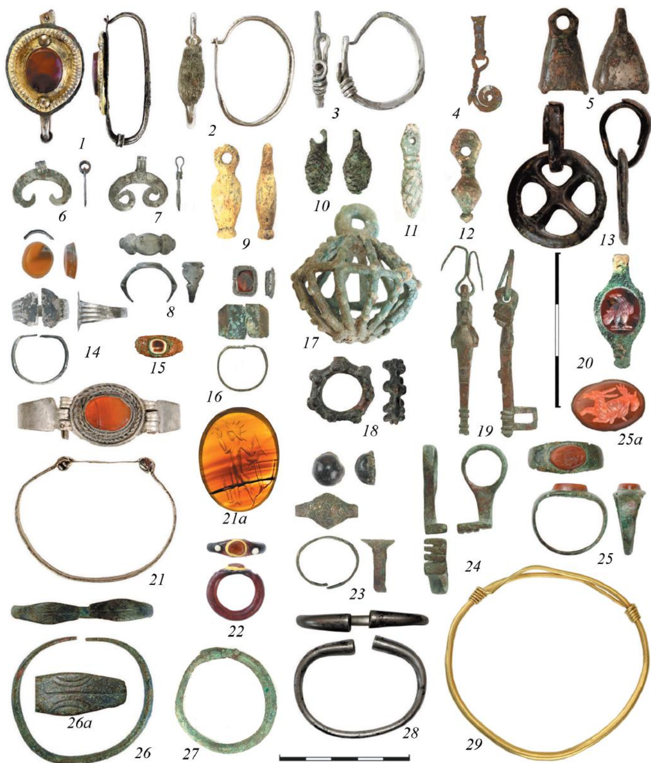
Рис. 6. Серьги, подвески, перстни, браслеты, ключи. 1 – погр. 16; 2 – погр. 13; 3 – погр. 27; 4 – погр. 33; 5 – погр. 257; 6–9 – погр. 33; 10 – погр. 273; 11 – погр. 240; 12 – погр. 8; 13 – погр. 257; 14 – погр. 45; 15 – погр. 230; 16 – погр. 3; 17, 26 – погр. 319; 18 – погр. 279; 19, 23, 25 – погр. 184; 20 – погр. 60; 21 – погр. 145; 22 – погр. 230; 24 – погр. 132; 27 – погр. 78; 28 – погр. 163; 29 – погр. 301.