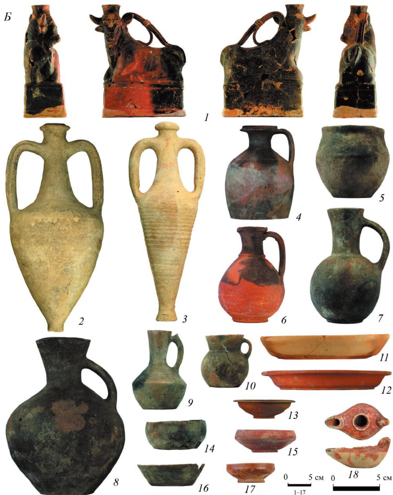
Рис. 3. Окончание. Б: 1 – погр. 317; 2 – погр. 170; 3 – погр. 89; 4 – погр. 51; 5 – погр. 52; 6 – погр. 51; 7 – погр. 52; 8 – погр. 51; 9 – погр. 137; 10 – погр. 154; 11 – погр. 136; 12 – погр. 41; 13 – погр. 52; 14 – погр. 96; 15 – погр. 104; 16 – погр. 178; 17 – погр. 104; 18 – погр. 136.