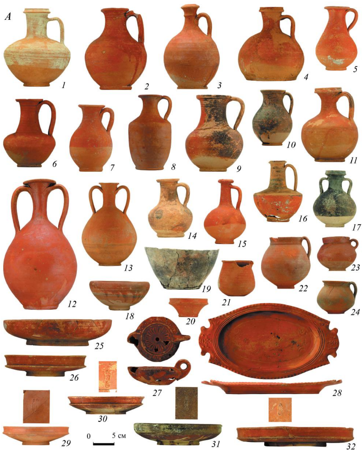
Рис. 3. Керамические сосуды. А: 1 – погр. 329; 2 – погр. 212; 3 – погр. 205; 4 – погр. 313; 5 – погр. 243; 6 – погр. 284; 7 – погр. 287; 8 – погр. 5; 9 – погр. 329; 10 – погр. 192; 11 – погр. 238; 12 – погр. 300; 13 – погр. 318; 14 – погр. 293; 15 – погр. 328; 16 – погр. 162; 17 – погр. 292; 18 – погр. 304; 19 – погр. 180; 20 – погр. 313; 21 – погр. 255; 22 – погр. 118; 23 – погр. 239; 24 – погр. 220; 25 – погр. 292; 26 – погр. 299; 27 – погр. 323; 28 – погр. 125; 29 – погр. 276; 30 – погр. 304; 31 – погр. 292; 32 – погр. 320.