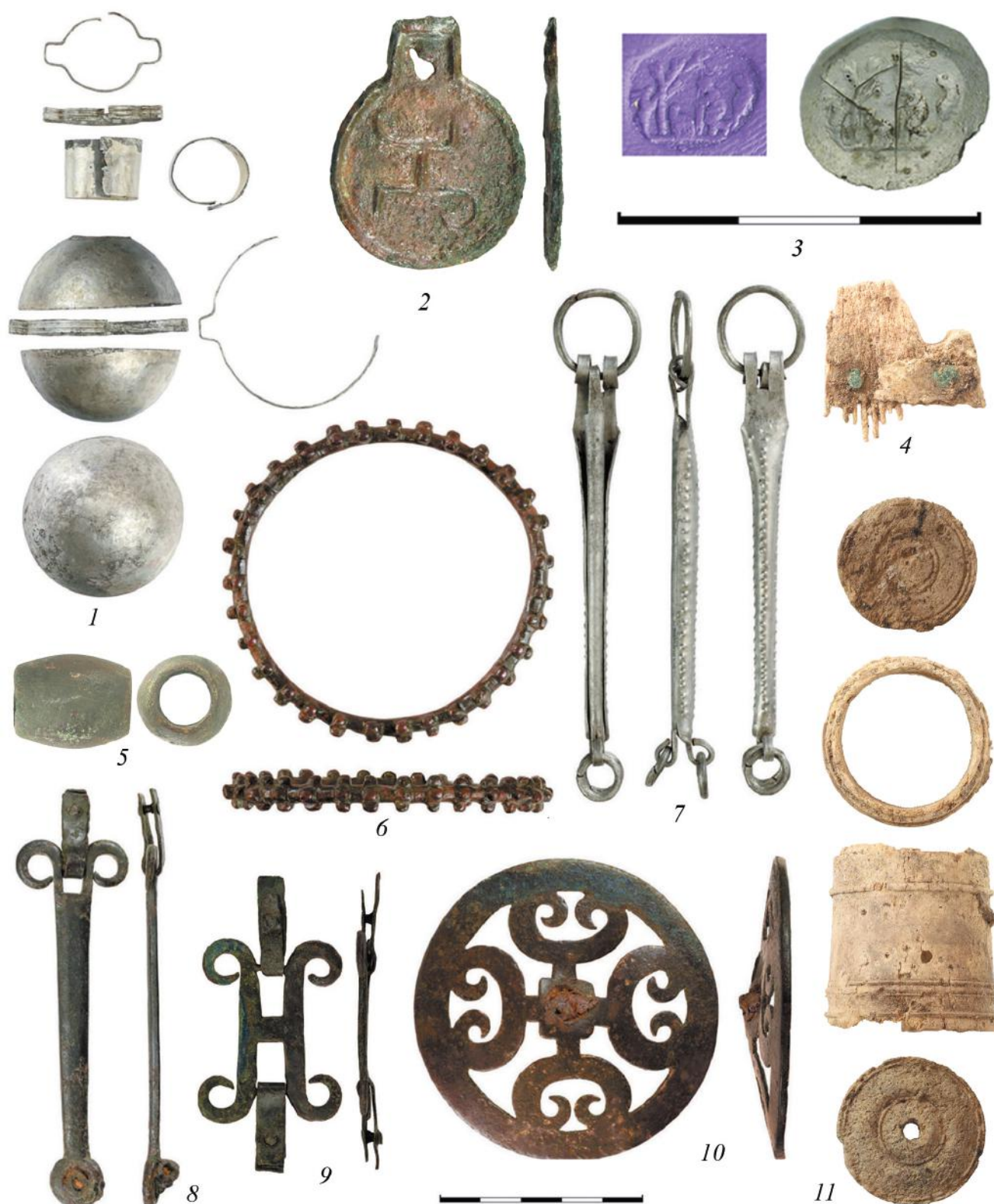
Рис. 7. Стеклянная вставка и слепок с нее (3 – погр. 141); зеркало (2 – погр. 184); флакон (1 – погр. 106); гребень и подвеска с футляром (4, 7 – погр. 6); “бусина” (5 – погр. 41); подвески, разделитель, псалий (6, 8–10 – погр. 319); пиксида (11 – погр. 322).

Fig. 7. A glass insert and an impression from it (3), a mirror (2), a bottle (1), a comb and a pendant with case (4, 7), a “bead” (5), pendants, a divider, a cheek-piece (6, 8–10); a pixis (11)