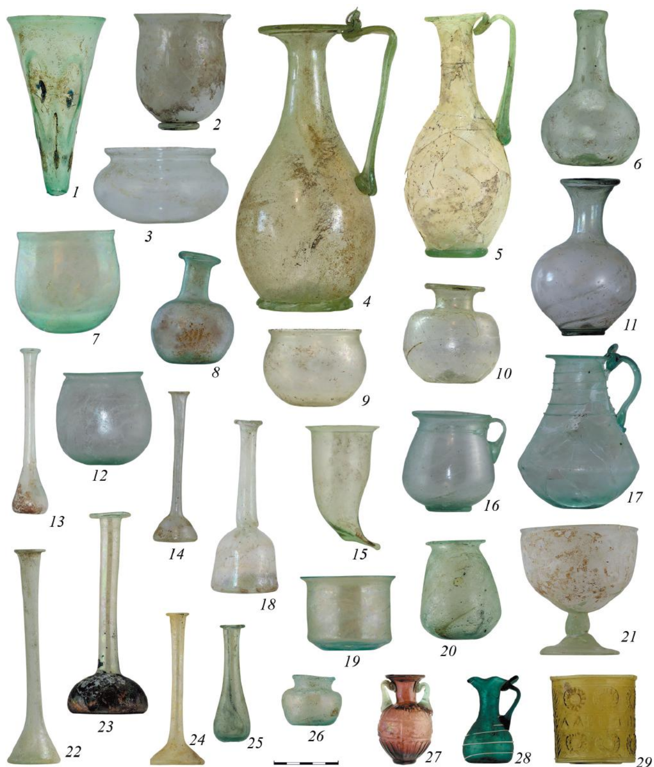
Рис. 4. Стекланные сосуды. 1, 2 – погр. 51; 3 – погр. 99; 4 – погр. 105; 5 – погр. 89; 6 – погр. 92; 7–8 – погр. 7; 9 – погр. 85; 10 – погр. 85; 11 – погр. 46; 12–13 – погр. 3; 14 – погр. 62; 15 – погр. 266; 16 – погр. 76; 17 – погр. 5; 18 – погр. 61; 19 – погр. 202; 20 – погр. 83; 21 – погр. 70; 22 – погр. 166; 23 – погр. 286; 24 – погр. 244; 25 – погр. 298; 26 – погр. 232; 27 – погр. 263; 28 – погр. 304; 29 – погр. 319.