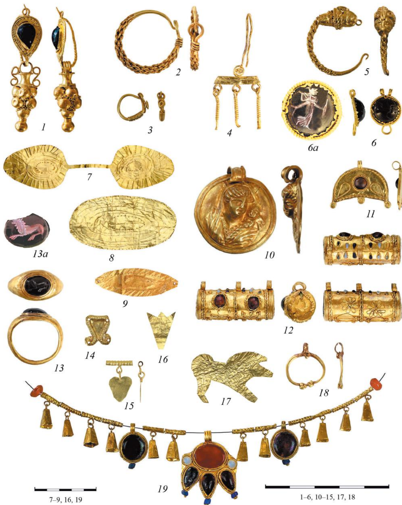
Рис. 8. Изделия из золота. 1 – погр. 136; 2, 13 – погр. 300; 3 – погр. 10; 4 – погр. 320; 5, 6, 14, 15 – погр. 312; 7, 8 – погр. 313; 9 – погр. 36; 10 – погр. 287; 11 – погр. 234; 12 – погр. 323; 16, 17 – погр. 317; 18 – погр. 205; 19 – погр. 208.