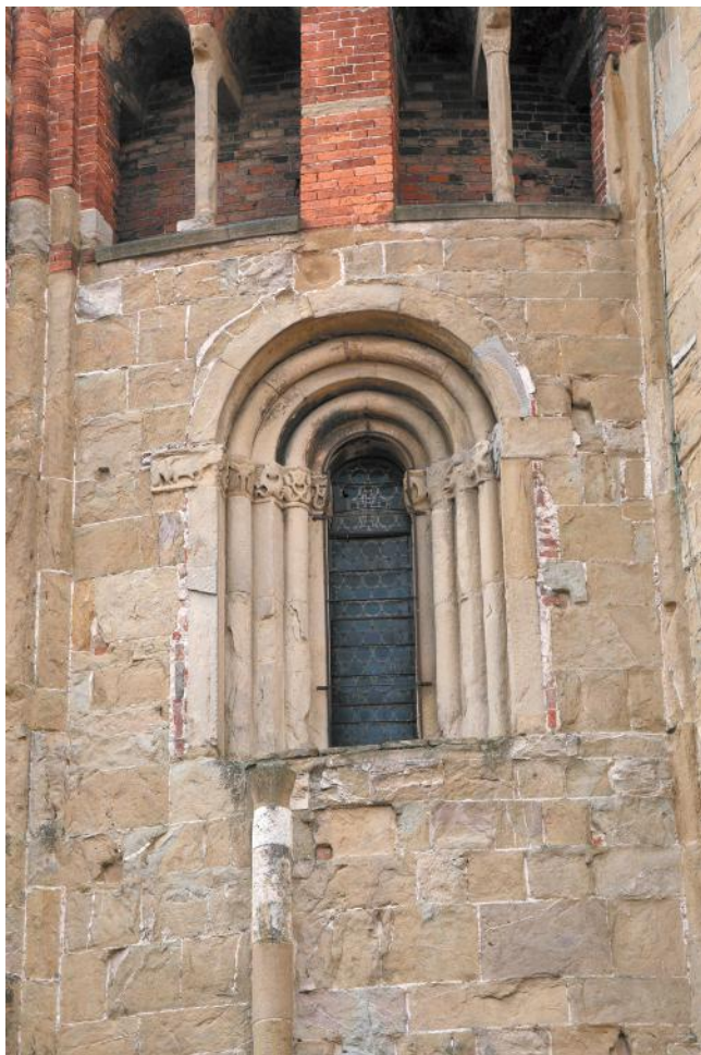
Рис. 6. Окно на абсиде церкви Сан-Микеле в Павии. Fig. 6. A window in the apse of the Basilica of San Michele in Pavia

Меньше окон с колонками в романской архитектуре Германии XII в.; отметим их присутствие в соборной церкви святого Серватиуса в замке Кведлинбурга (Quedlinburg; Mrusek, 1972. III. 54. S. 225) и соборной церкви в Вексельбурге (Wechselburg; Mrusek, 1972. III. 87. S. 229).