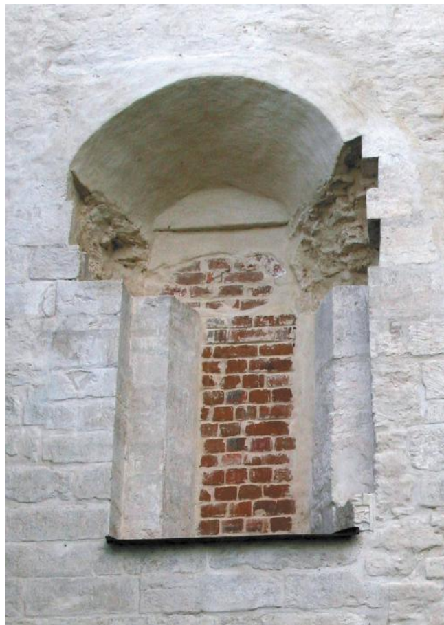
Рис. 2. Окно восточного прясла южного фасада Суздальского собора.

Fig. 2. The window in the eastern part of the southern facade of the Suzdal Cathedral