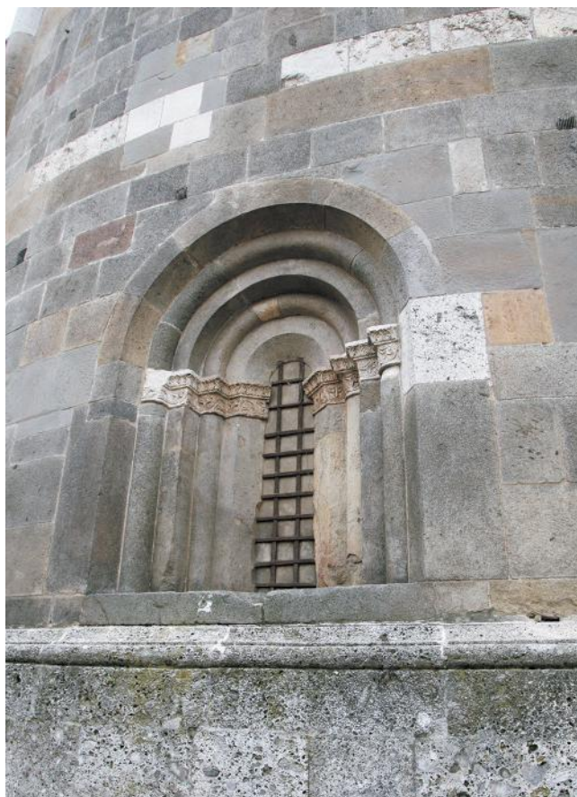
Рис. 5. Окно на апсиде собора в Кремоне.

Приведенными ломбардскими аналогами круг возможных образцов для окон Суздальского собора не исчерпывается. Подобные окна, как простые, так и очень сложноработанные, в большом количестве присутствуют в романской архитектуре Франции. Назовем следующие памятники французской романики, относящиеся к XII в.: церковь Сен-Сернен в Тулузе (Saint-Sernen, Toulouse;