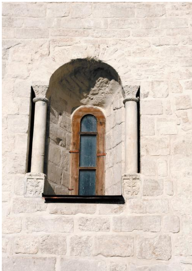
Рис. 3. Окно северного прясла западного фасада Суздальского собора.

в 1940-х или 1950-х годах, нашел такое окно. Н.Н. Воронин в своей обобщающей работе коснулся вопроса об окнах, он пишет, сначала сославшись на Н.А. Артлебена: “Рисунок этого окна, изданный Н.А. Артлебенем, был сделан незадолго до растески окна; кроме того, Н.А. Артлебен ссылается на имеющийся фотографический снимок окна. Это позволяет доверять его показаниям, хотя на рисунке собора окно и не показано. Выше мы видели примеры помещения окон между колонками пояса (Боголюбово, Успенский собор и его галереи). Строители Суздальского собора сделали следующий шаг, превратив звено пояса в наличник окна. Это подтверждается окном, которое открыл А.Д. Варганов в восточном делении южного фасада собора. Здесь по сторонам оконного проема сделаны неглубокие выемки; в них вставлены колонки, опирающиеся на аналогичные базам пояса кубические подставки и завершаемые капителями, на которые ложатся пяты арочной перемычки” (Воронин,